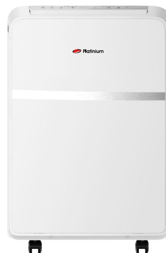
P09CX - 9000 BTU