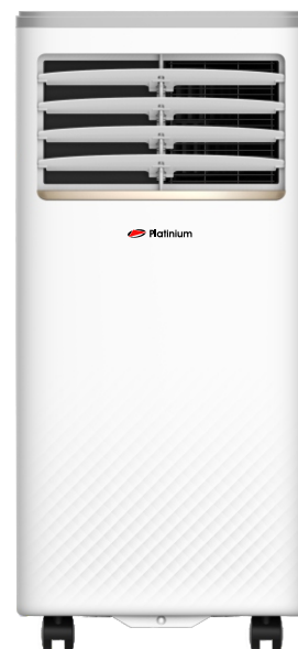
P07CX - 7000 BTU